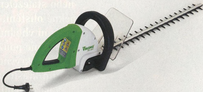
46 Živý plot si péči zaslouží