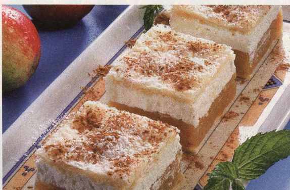
26 Pečeme s lístkovým těstem