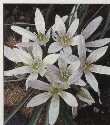
30 Bílá zahrada