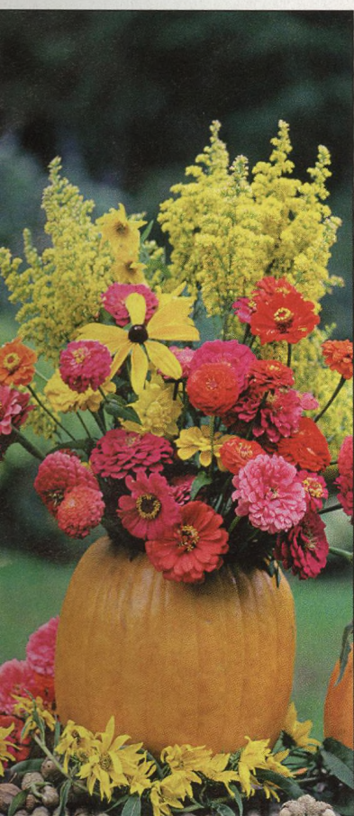
42 Podzimní inspirace