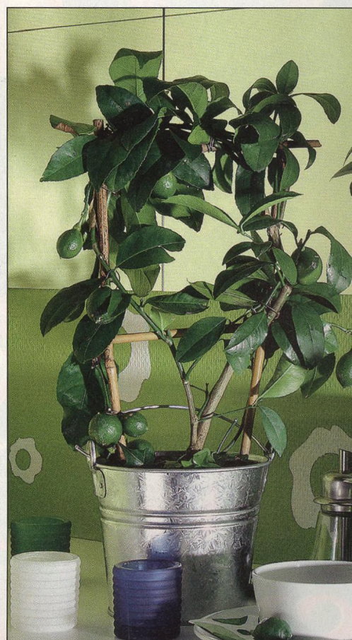
66 Popínavky v bytě