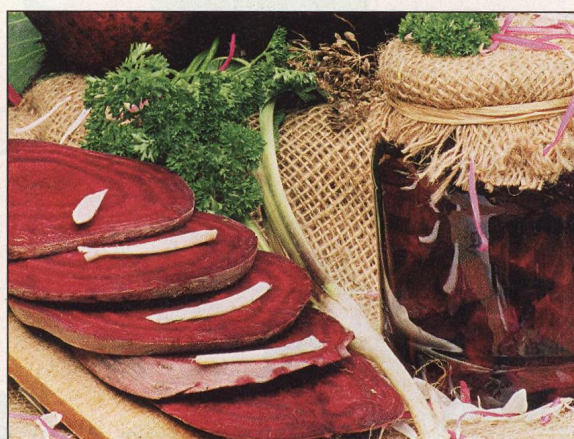
18 Červená řepa salátová dokáže zázraky