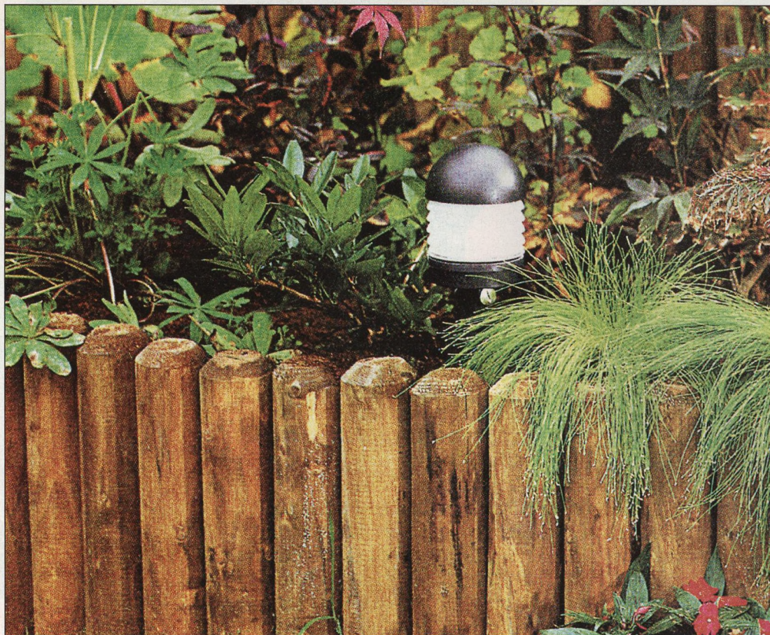
64 Kulatina v zahradě – na altánek i na schody