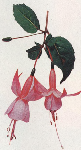
42 Fuchsie v zimě