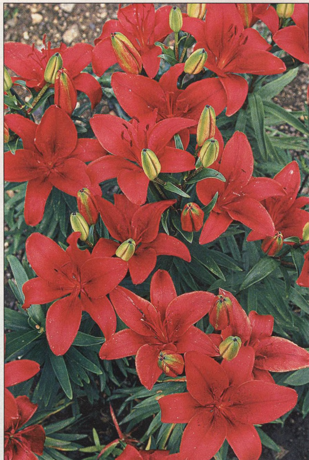
30 Červená vřdycky potěší