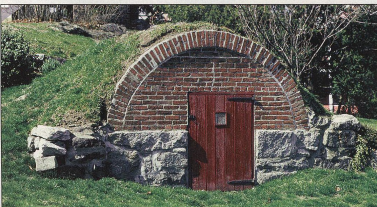
70 Skladujeme ovoce a zeleninu