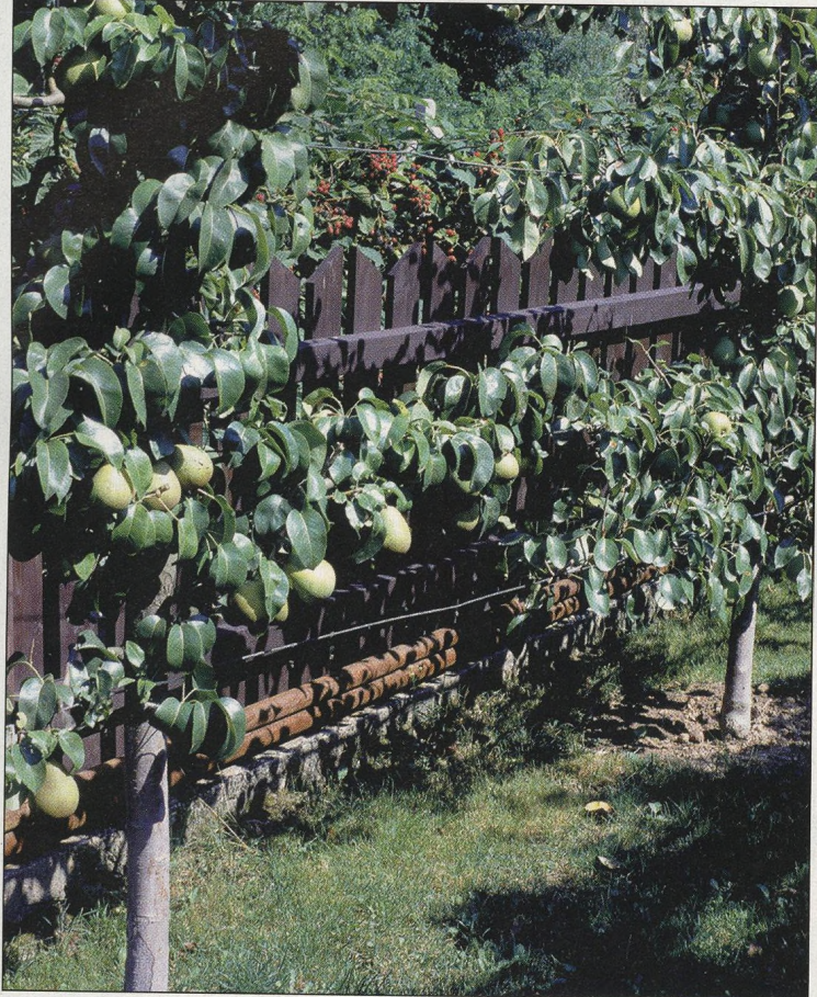
12 Jak rekonstruovat ovocnou zahradu?