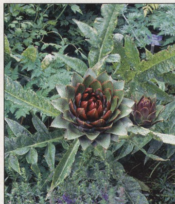
18 Trvalá zelenina před zimou