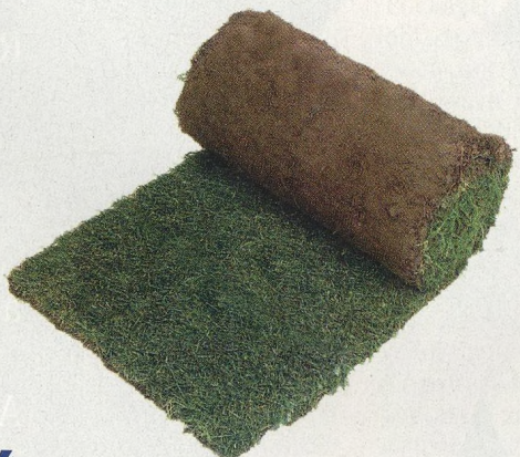
54 Trávník nesmí chybět