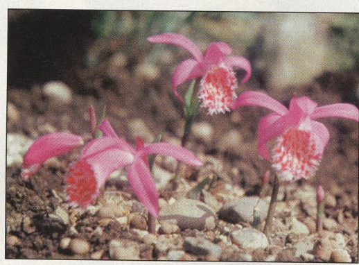
59 Pleione – kráska z Tibetu