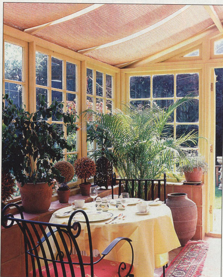
66 Zimní zahrada – zelený i kvetoucí ráj