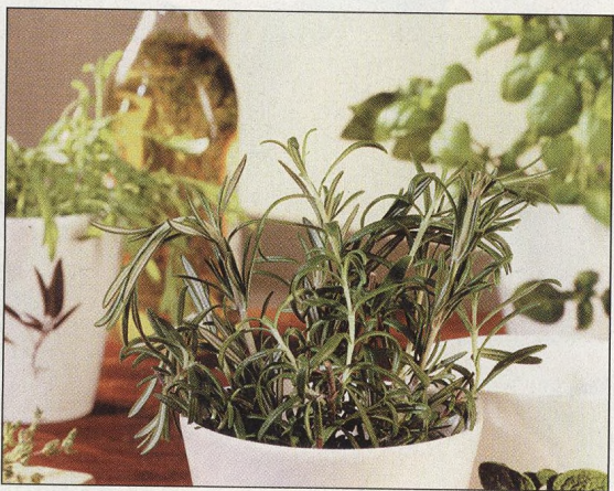
28 Léčivky a kořeniny v bytě