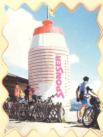
ALPSKÉ PRŮSMYKY 34 - 37