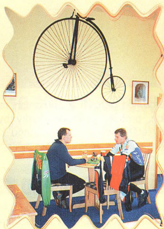
STŘÍPKY Z HISTORIE 58 - 59