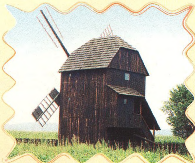
NA KOLE ZA VĚTRNÝMI MLÝNY 48 - 49