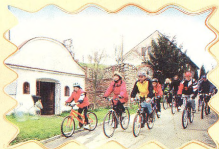
VINAŘSKÉ STEZKY NA JIŽNÍ MORAVĚ 14 - 15