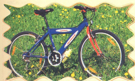
AUTHOR SIGNAL 51