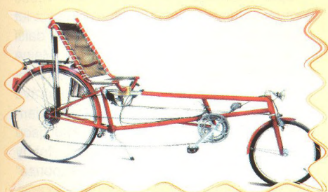
KOLA ZVANÁ LEŽATÁ 44 - 45