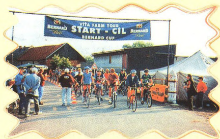
VÍTA FARM TOUR A BERNARD CUP 60