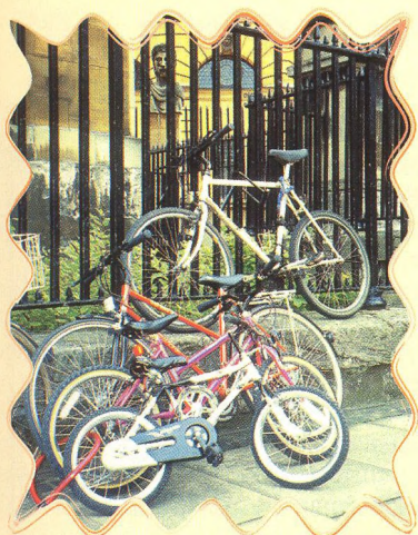
NENECHTE SI SVÉ KOLO UKRÁST 24 - 29