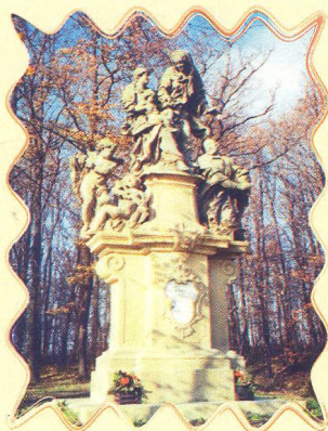
ZÁHOŘÍ 18 - 20