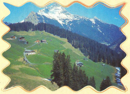
ALPSKÉ PRŮSMYKY 30 - 32