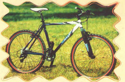
SCOTT - VAIL 47