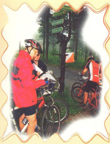
PODĚBRADKA BIKE ADVENTURE 34 - 36