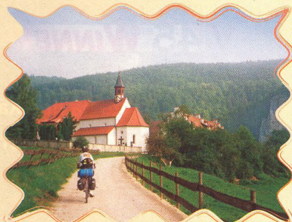
K PRAMENI DUNAJE 26 - 28