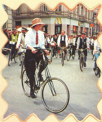
MS HISTORICKÝCH VELOCIPEDŮ 14 - 15