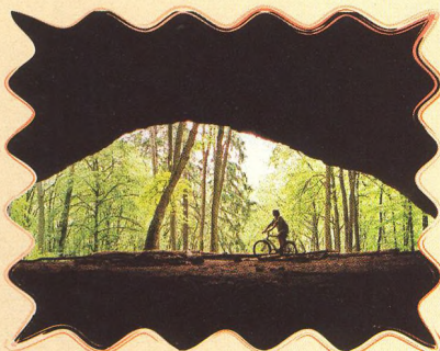
MORAVSKÝ KRAS I. 18 - 20