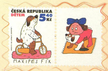
MOZAIKA CYKLOZAJÍMAVOSTÍ 6 - 7