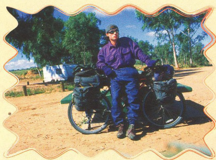
K NEJVĚTŠÍMU MONOLITU SVĚTA 8 - 13