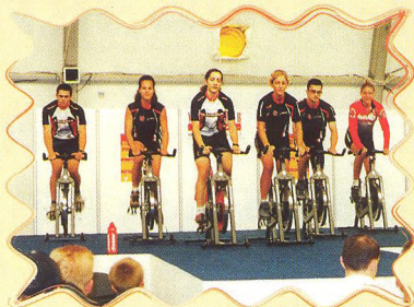
SPORT PRAGUE 2000 - PODZIM 15