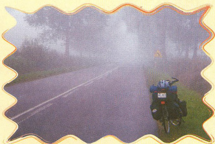
PODZIMNÍM POLSKEM 26 - 28