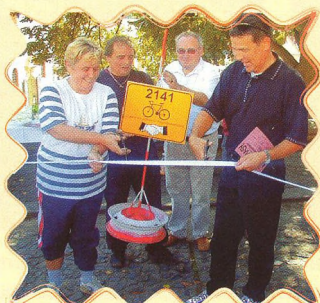
CYKLOTRASA PŘÁTELSTVÍ 53