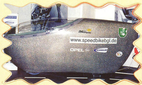
IFMA 2001 38 - 40