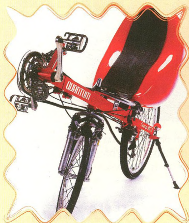
KOLA ZVANÁ LEŽATÁ 36 - 37