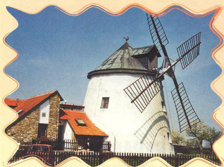
VĚTRNÉ MLÝNY JIŽNÍ MORAVY 42 - 43