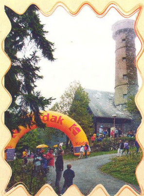
KODAK SVATOBOR TOUR 23