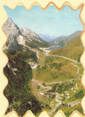
ALPSKÉ PRŮSMYKY 30 - 32