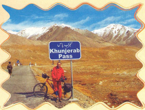
PÁKISTÁN NA KOLE 8 - 14