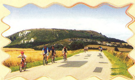
KRAJEM VÍNA A PAMÁTEK 19 - 22