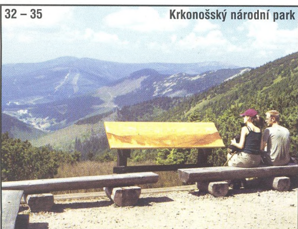
32 – 35 Krkonošský národní park

8 Zahraniční cyklotrasa Provence a Languedoc II.