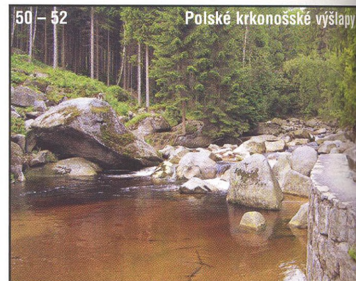
50 – 52 Polské krkonošské výšlapy