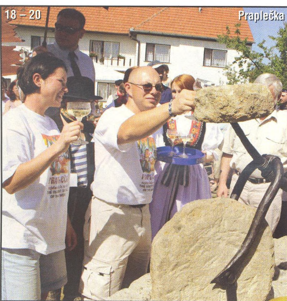
18 – 20 Praplečka