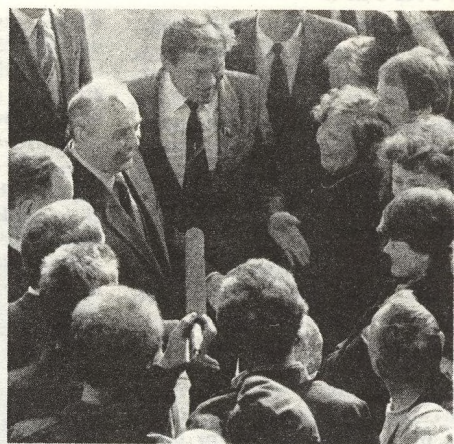
2 MILNÍKY cest Michaila Gorbáčova po Sovětském svazu nejsou oficiální přijetí a recepce, ale setkání s pracujícími. Otevřenost je hlavní hybnou silou NA CESTĚ PŘESTAVBY