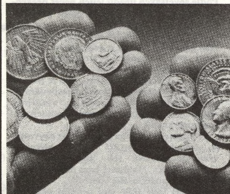
2 JSOU DEVIZOVÉ ÚVĚRY POTŘEBNÉ? Toto téma rozebírá v rozhovoru pro list Izvěstija předseda vedení Banky pro vnější hospodářskou činnost SSSR Jurij Moskovskij