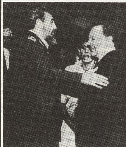
8 U PŘÁTEL ZA OCEÁNEM Na Kubě a v Nikaragui pobýval v prvních dnech nového roku generální tajemník ÚV KSČ Miloš Jakeš