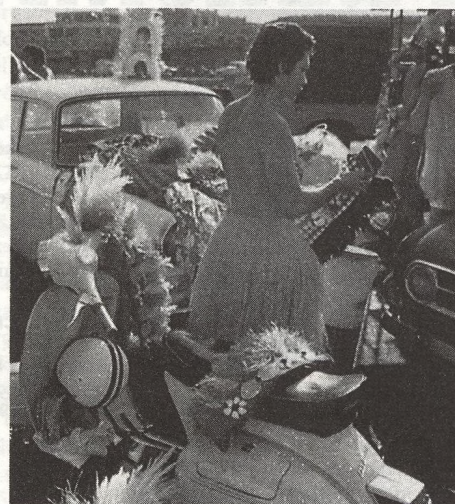
6 ZTRACENÝ RÁJ - sociální napětí na Tahiti vyvolalo nepokoje místního obyvatelstva