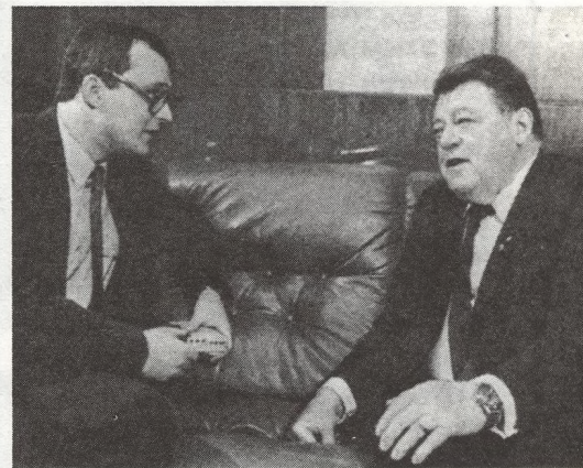
4 MÍSTO HOVORŮ O PŘÁTELSTVÍ - sovětský list přinesl interview s F. J. Straussem