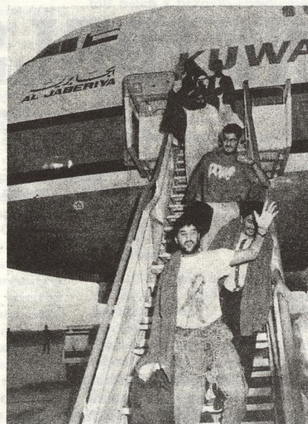
2 NEJDELŠÍ dva týdny svého života zřejmě prožili cestující Boeingu kuvajtských aerolinií, uneseného v dubnu skupinou členů organizace Islámské svaté války