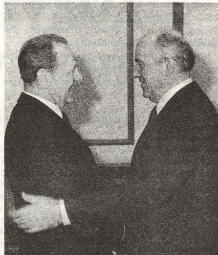
10 VÝZNAMNÉ MISE, obrazová reportáž z nedávných cest generálního tajemníka ÚV KSČ Miloše Jakeše do evropských socialistických zemi