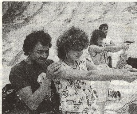
4 PRYČ od svých vil, bazény a tenisových kurtů. Ti, kdo se nechtějí za žádnou cenu vzdát svých privilegií, se učí střilet; ostatní přemýšlejí, jak Z JOHANNESBURGU přesídlit do ciziny