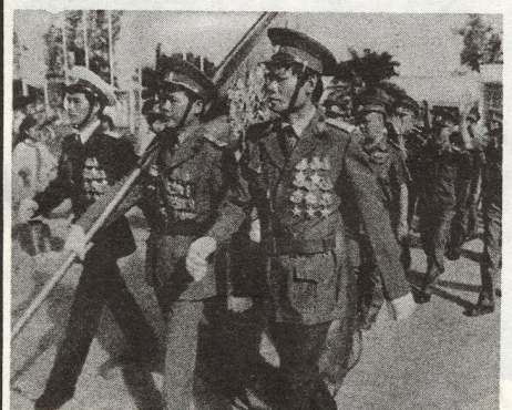
6 KŘEHKÉ KOMPROMISY byly výsledkem jednání o kampučském problému, které se konalo v Indonésii. Teprve budoucnost ukáže, zda se zúčastněné strany chopí šance Z BOGORU

ČTK přijme za výhodných podmínek pisařky na elektrických strojích. Informace na pražském telefonním čísle 22 52 44.