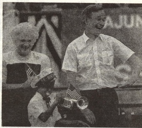
4 TO, co vidíte na snímku, není premiéra v Hollywoodu, ale sjezd Republikánské strany v New Orleansu. Kdo nezná teatrální sklony americké politiky, byl by asi překvapen, jaká to BYLA SHOW!