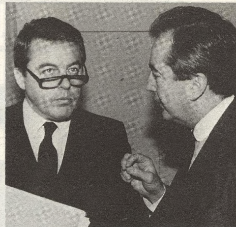
4 Předsedové stran, jež v Rakousku vytvořily „velkou koalici“, Franz Vranitzky a Alois Mock, ve vážném rozhovoru