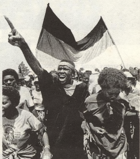
6 Striktní tiskovou cenzuru vyhlásila vláda rasistické JAR na zprávy a snímky dokazující nezvratnou skutečnost: občanskou válku v zemi