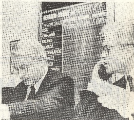
7 Zmatek na mezinárodních devizových trzích dostoupil začátkem letošního roku vrcholu. Je to skutečná válka nervů