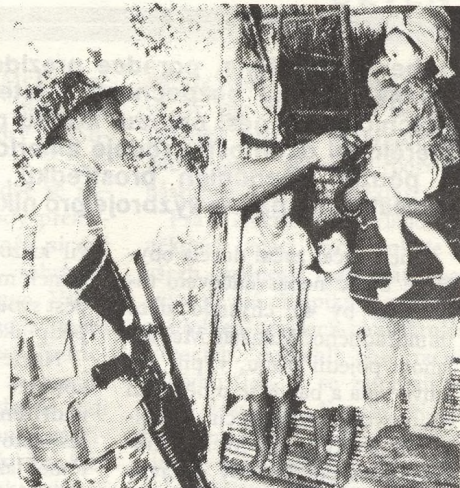
4 Po šedesátidenním příměří mezi levicovými silami a vládními jednotkami na Filipínách očekávají síly NDF nové útoky armády. Na obr. jeden z členů NDF se loučí s rodinou