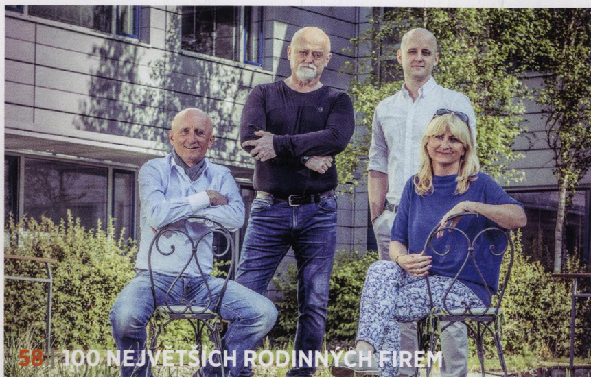
58 | 100 NEJVĚTŠÍCH RODINNÝCH FIREM