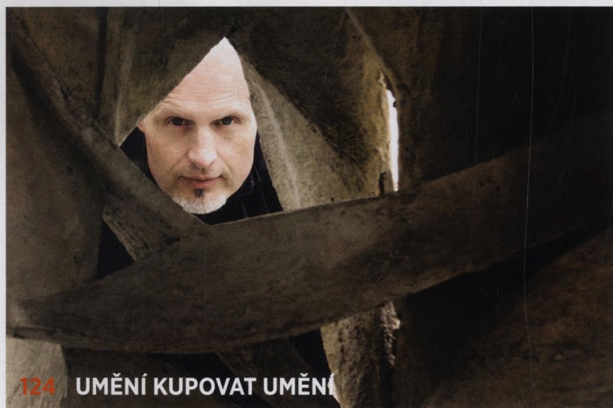
124 | UMĚNÍ KUPOVAT UMĚNÍ