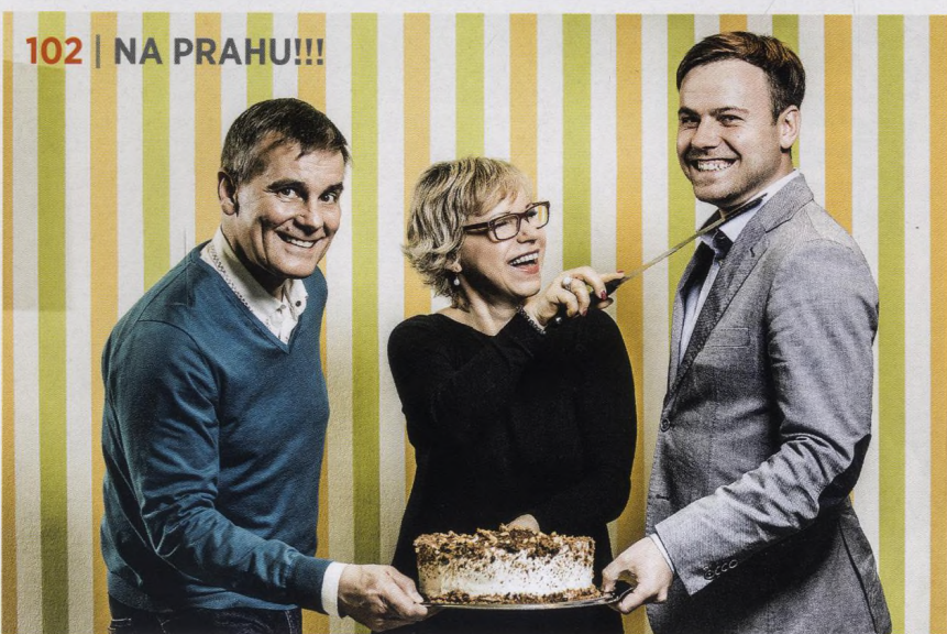
102 | NA PRAHU!!!