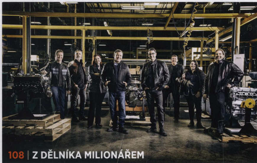
108 | Z DĚLNÍKA MILIONÁŘEM