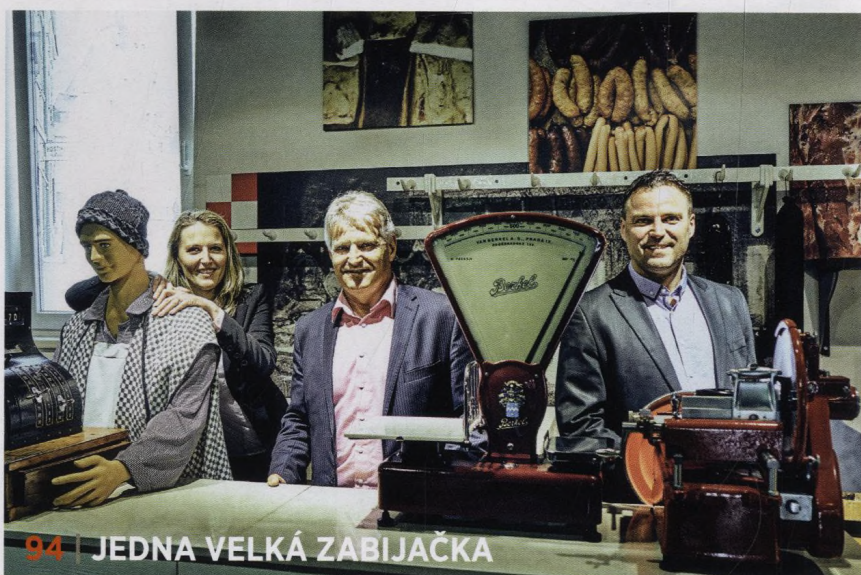
94 | JEDNA VELKÁ ZABIJAČKA