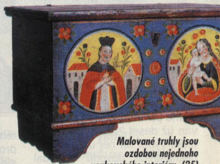
Malované truhly jsou ozdobou nejednoho venkovského interiéru. (25)