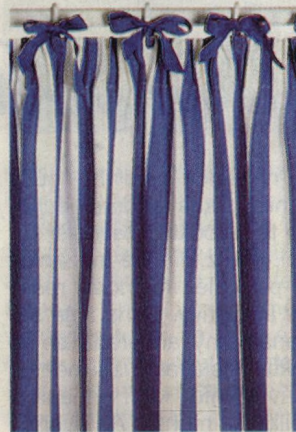
Netradiční aranžmá závěsů. (36)