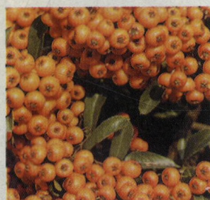
I na zimní zahradě nás mohou rostliny překvapit svou barevností. (38)