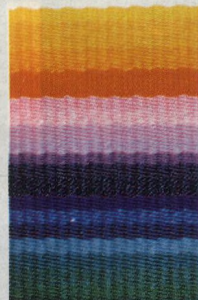
Na starém ručním stavu se rodí moderní tkané prostorání. (48)