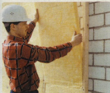
I když venku mrzne, můžeme stavení zateplovat tzv. suchou cestou. (28)