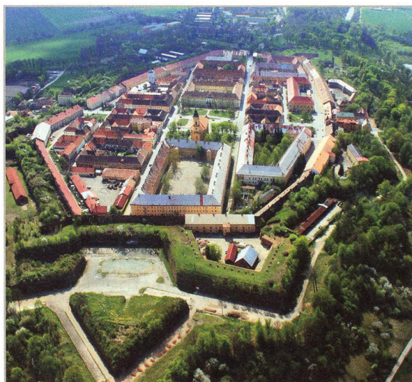
Letecký pohled na pevnost Josefov založenou koncem 18. století (str. 8)

Poslední dva přemyslovští králové, Václav II. a Václav III., na portrétech od Jana Hory (str. 24)