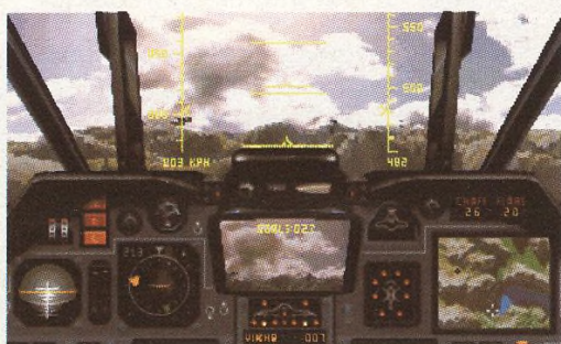
Xixit ..... 22