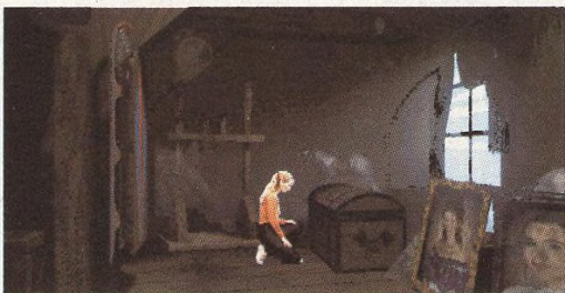
Space Quest VI ..... 14