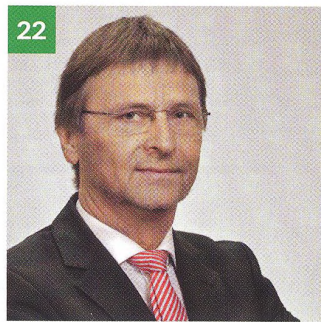
22 Messen als facettenreiche Plattform