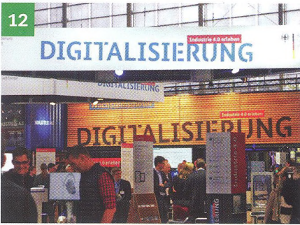
12 Hannover Messe 2017