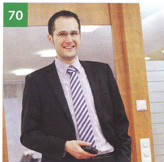
70 Darf man sich auf Pläne verlassen?

Titelbild Eine leicht zu reinigende „Slimline“-Massagedüse für Whirlpools von Repabad, Wendlingen