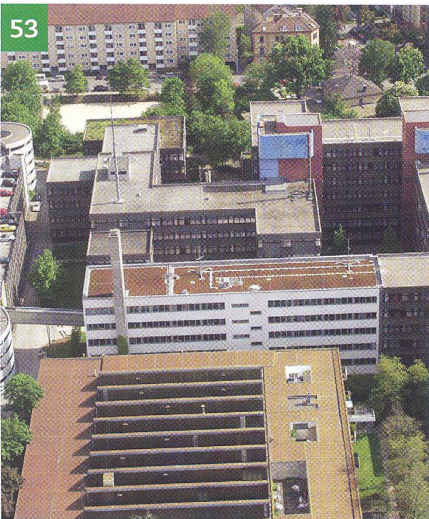
53 Contracting im LKA