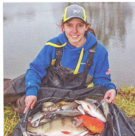
24 Přemýšlejte a... chytejte!