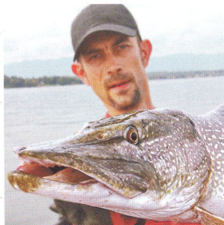
04 Lac Léman