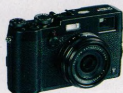
Na stranách 18–21 vám poradíme, jak si vybrat vhodný digitální fotoaparát

Pětí výhercům věnujeme batoh značky Topgal na notebook.