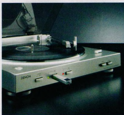
Převďte svoji hudební sbírku do souborů MP3 (str. 12–17)