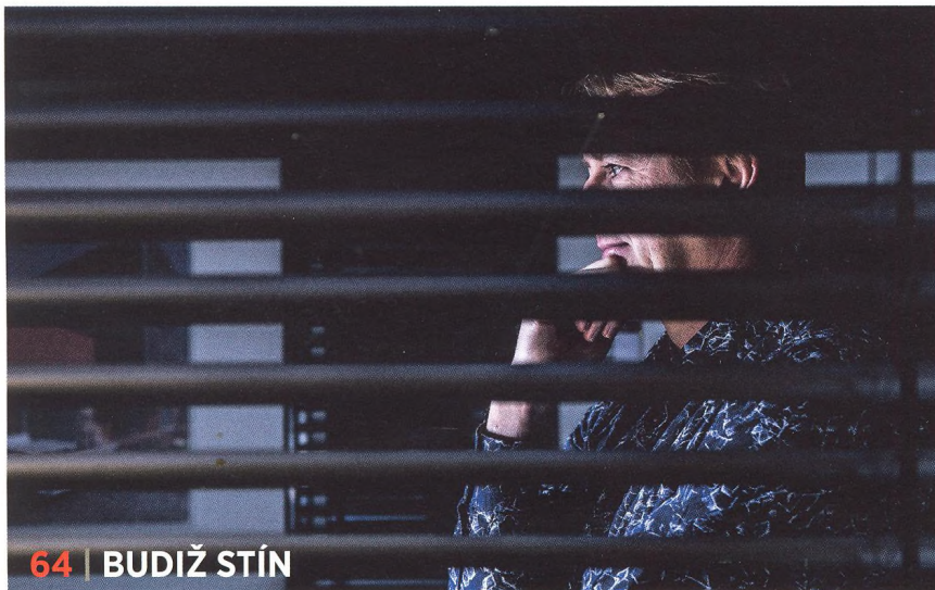
64 | BUDIŽ STÍN