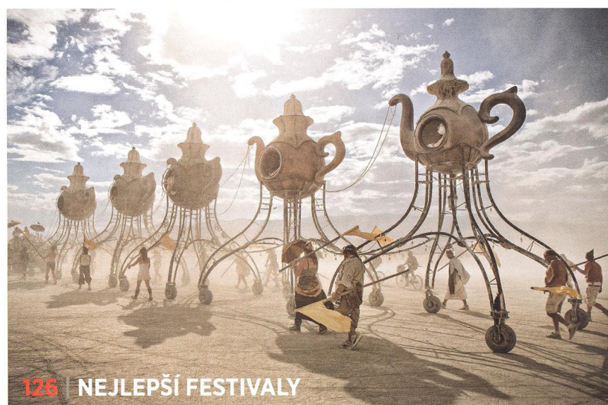
126 | NEJLEPŠÍ FESTIVALY