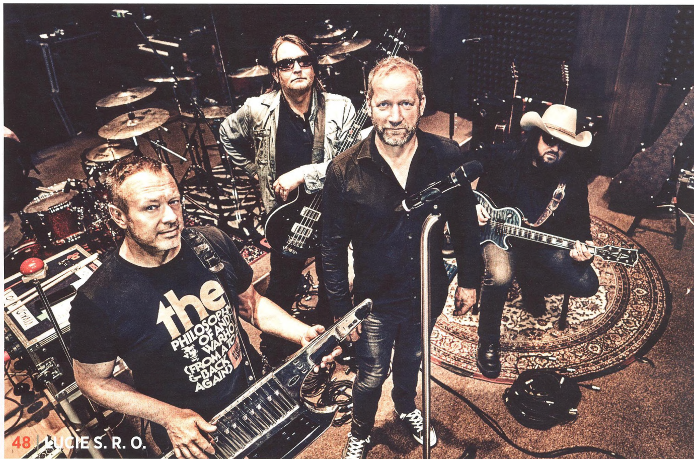
48 | LUCIE S. R. O.