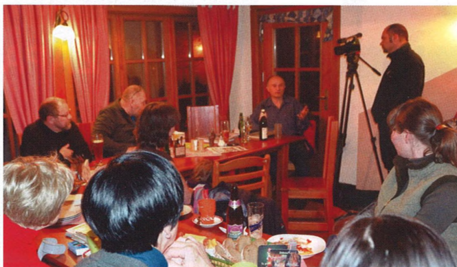
Schůzka přátel Luftu 15. 12. 2012 v osvědčeném pohostinném prostředí salonku restaurace penzionu Bohemia na náměstí Svatého Vavřince v Horní Blatné

na sebe. Naším cílem – kromě dalšího zkvalitňování obsahu – je rozšířit prodej také za Klínovec a v lidnatějších městech Jáchymov, Nejedek, Rotava či Kraslice, chceme dosáhnout zvýšení zásilkového prodeje Luftu poštou do schránky přátelům Krušných hor v ČR i češtinářům v Sasku na opačné straně Erzgebirge, uvažujeme o tisku německé verze Luftu, našel-li by se překladatel-nadšenec. S vyšší cenou za tisk v nové tiskárně jsme se zatím museli vyrovnat, doufáme však, že prodej podpoří také vyšší kvalita fotek a nové uspořádání textů.