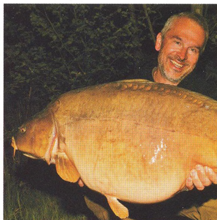
10 Jak na kapry v létě