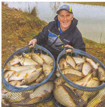
34 Čím vnařit / vybírejte dobře