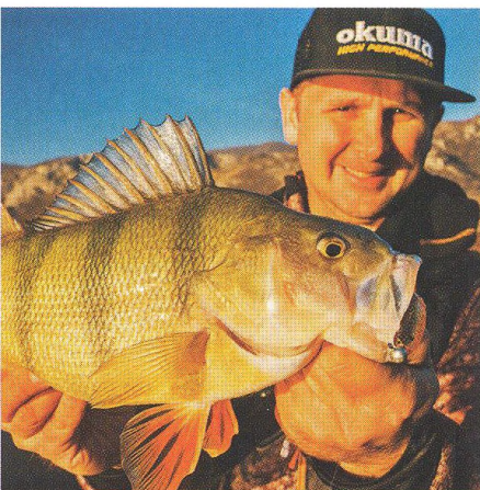
04 LRF / blízká setkání s predátory