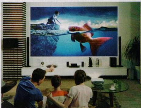
Projektory pro domácí kino představujeme na stranách 16–21