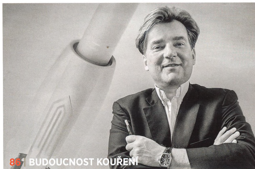
86 | BUDOUCNOST KOUŘENÍ