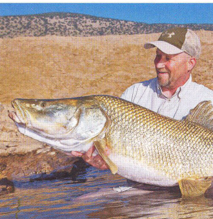
04 Obří parmy / z hrobek v Chúzistánu