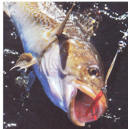
34 Moře plné překvapení / na rybách v Mefjord Brygge