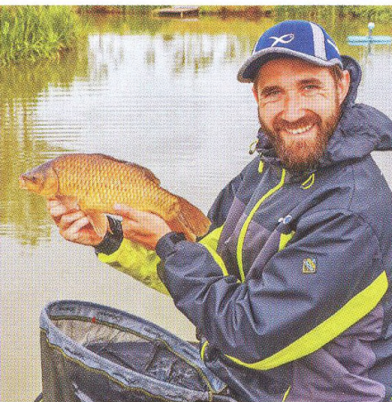
22 Letní lovy / v mělčích partiích revíru