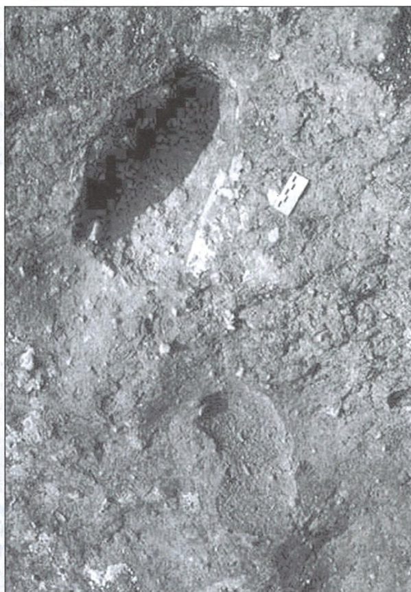
Jedna z d'áblových stop“ na svahu vulkánu Roccamonfina.

Před 325 000 lety lidské bytosti malého vzrůstu opatrně sestupovaly ze svahu italského vulkánu Roccamonfina. Jejich stopy jsou pravděpodobně nejstarší, které byly dosud objeveny. Po jedné z předhistorických erupcí vulkánu severně od Neapole zanechali v horkém popelu své stopy tři poutníci. Jejich zkamenělé stopy jsou dnes 385 000 nebo 325 000 let staré, říkají italská badatelé.