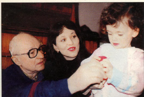
dcerka Karolínka. O štěstí, které jim vnesla do života, vypráví dnešní část seriálu Neznámá tvář známé osobnosti.