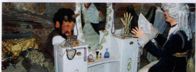
Čertovina: Zábavní areál pro děti