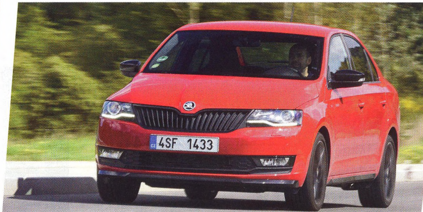
Škoda Rapid Monte Carlo

V tipech na výlet expozice v italské Veroně ..... 73