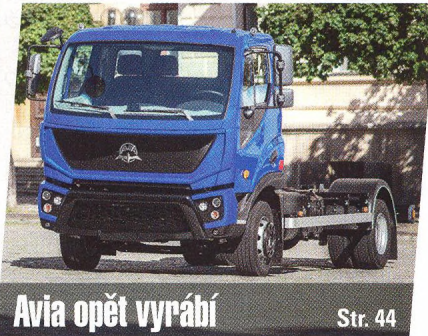
Avia opět vyrábí