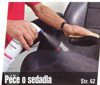
Péče o sedadla