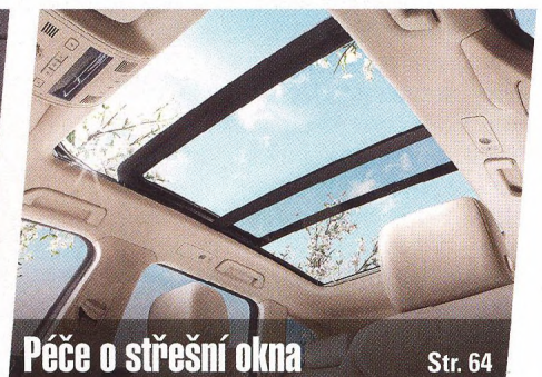
Péče o střešní okna