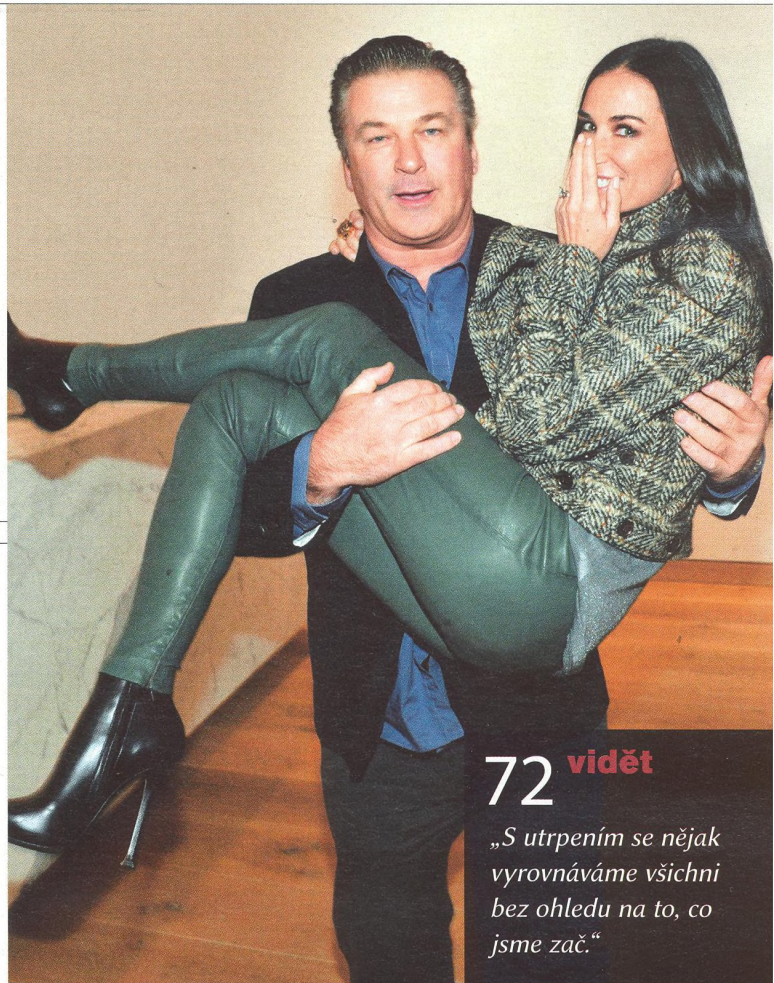
DEMI MOORE & ALEC BALDWIN herci

„Jako předseda poroty se chci soustředit nikoli na již přesvědčené ochránce přírody a ekology, ale na běžné diváky, kteří zatím ještě silný názor nemají.“