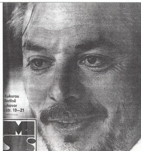
Kukurou Berlíně řehovor str. 19–21

„S utrpením se nějak vyrovnáváme všichni bez ohledu na to, co jsme zač.“