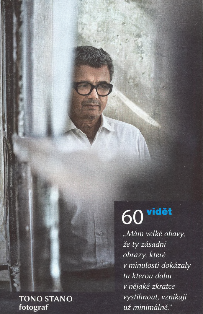
TONO STANO fotograf