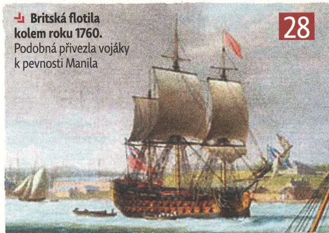
↳ Britská flotila kolem roku 1760. Podobná přivezla vojáky k pevnosti Manila