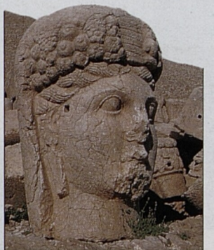
Kommagénská kamenná hlava na hoře Nemrut (Nemrut Dağı)