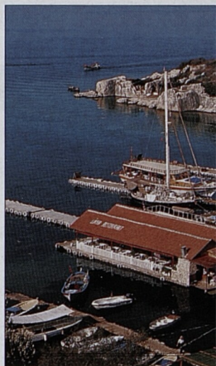
Vesnice Uçağiz na pobřeží Středozemního moře