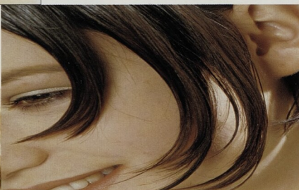
HNED HOTOVÉ: snadné a slušivé