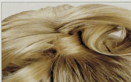
PROMĚNY: každý den jiná

Dlouhé – slušivé efekty v mžiku ..... 124