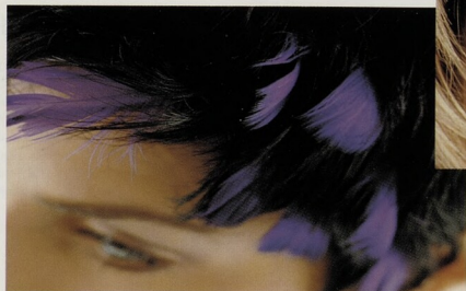
BARVA: hra s odstíny