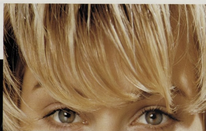
KLASICKÉ: nikdy nevyjdou z módy