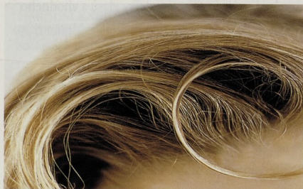
NADÝCHANÉ: prostě více vlasů