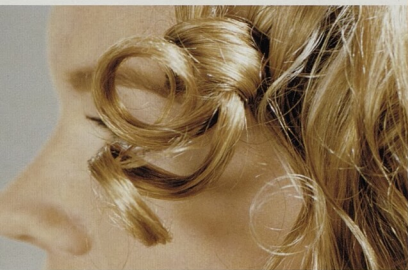
DETAILY: trochu originality