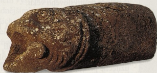
ŘÍMSKÝ CHR LIC VE TVARU RYBÍ HLAVY