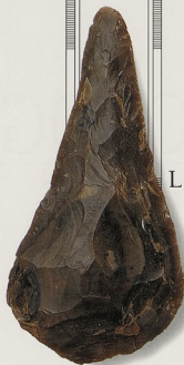
PALEOLITICKÁ RUČNÍ SEKYRKA