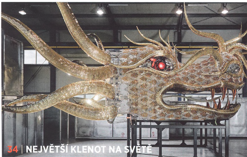
34 | NEJVĚTŠÍ KLENOT NA SVĚTĚ