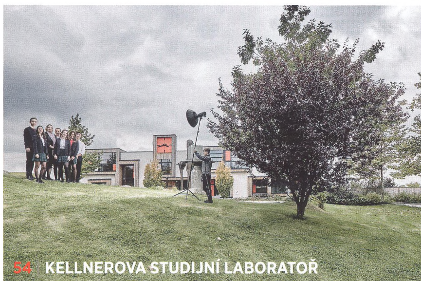
54 | KELLNEROVA STUDIJNÍ LABORATOŘ