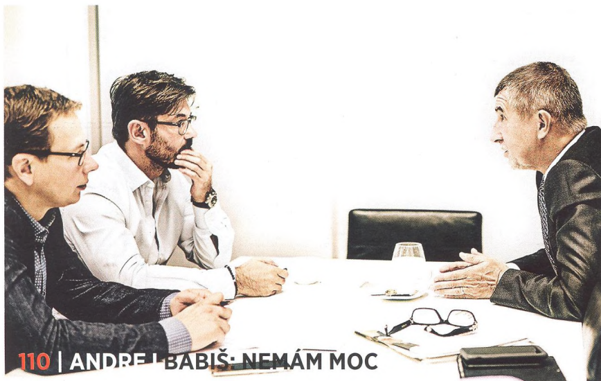
110 | ANDREJ BABIŠ: NEMÁM MOC