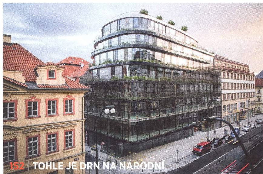
152 | TOHLE JE DRN NA NÁRODNÍ