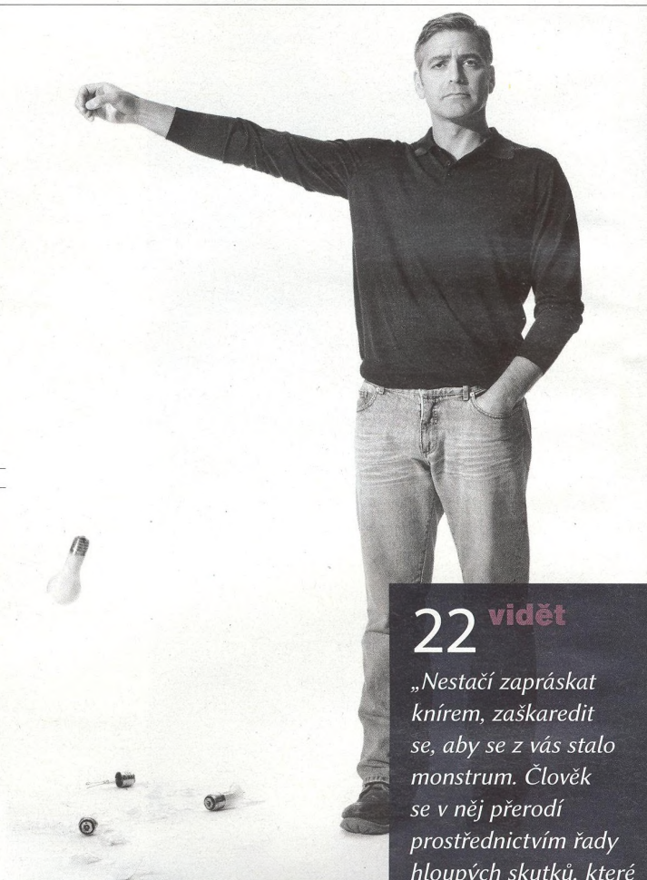
GEORGE CLOONEY herec, režisér

„Nestačí zapráskat knírem, zaškaredit se, aby se z vás stalo monstrum. Člověk se v něj přerodí prostřednictvím řady hloupých skutků, které vrší jeden na druhý.“