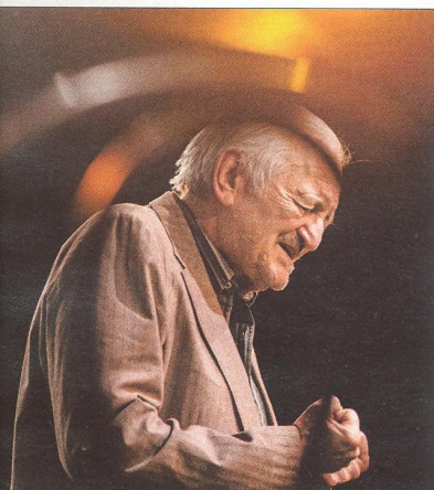
MILAN LASICA herec

„V Praze a vůbec v České republice se za posledních dvacet let nepostavila žádná avantgardní stavba, která by oslovila svět.“