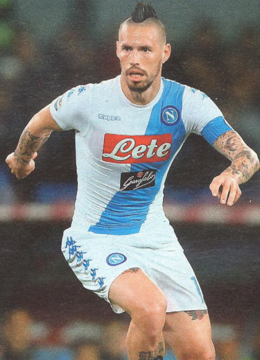
MAREK HAMŠÍK fotbalista

„Když mi trenér řekl, že mě chce za kapitána, byl jsem ohromně překvapený. Budu si to pamatovat do konce života.“