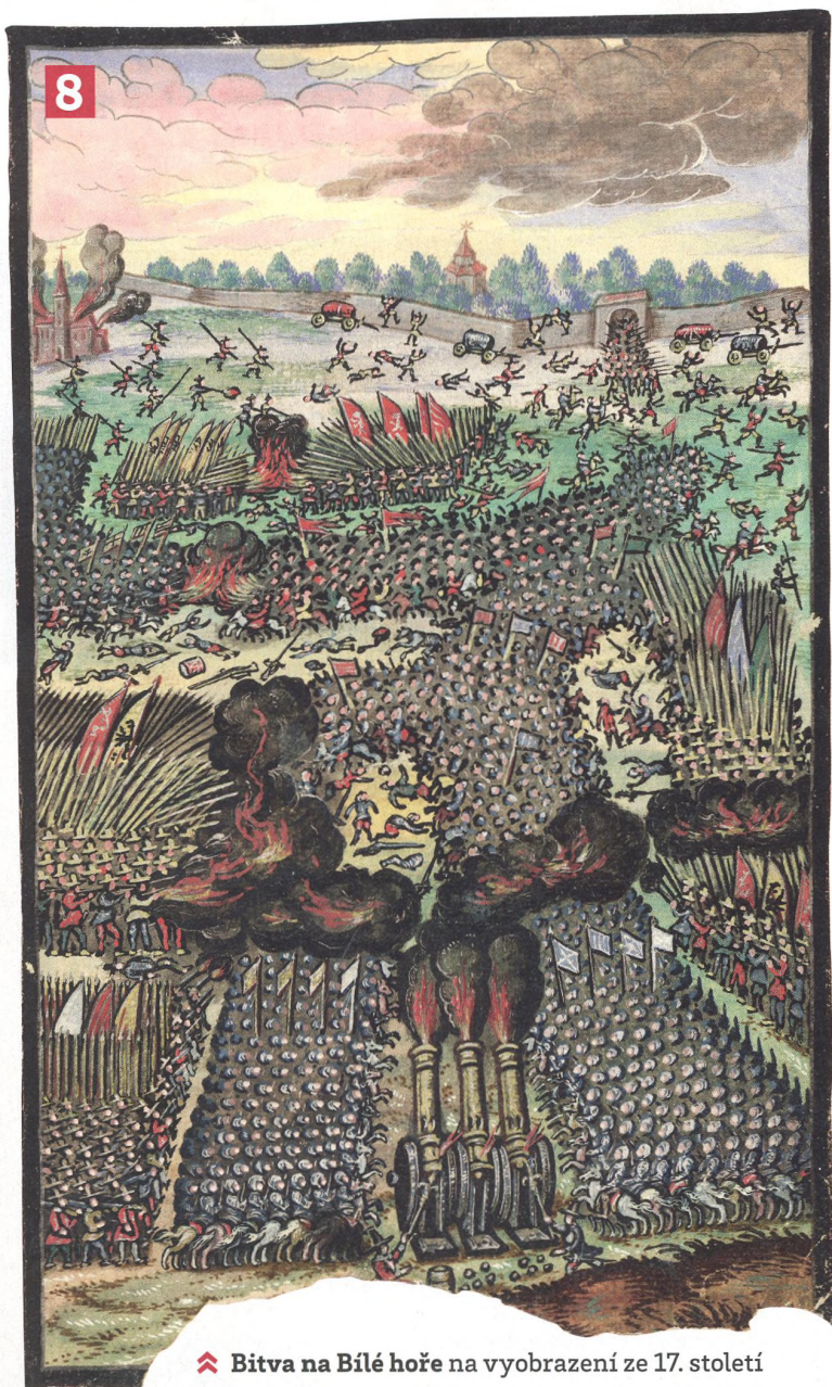
❖ Bitva na Bílé hoře na vyobrazení ze 17. století