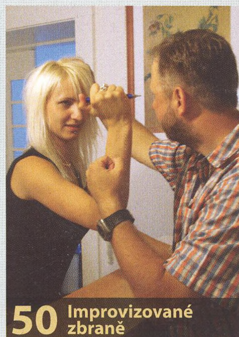
50 Improvizované zbraně