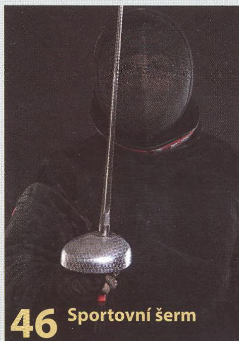
46 Sportovní šerm