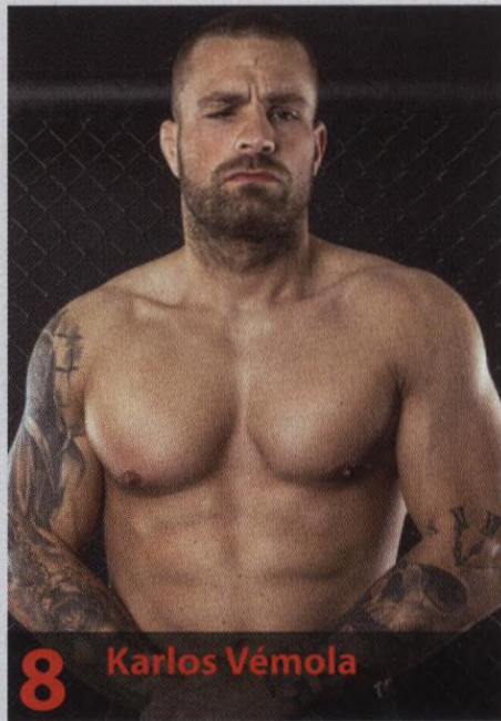
8 Karlos Vémola