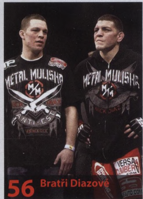
56 Bratři Diazové