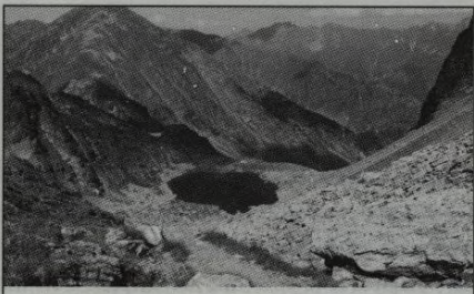
15| První den dospělosti

P.S.: Výroční zprávu Sedmé generace za loňský rok zavěsíme na web 25. června.