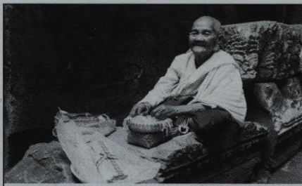
16| Ekoturistika s chutí kardamomu