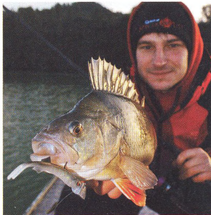
18 Je to jenom v hlavě?! / rozdíl zvaný Twitch Jig