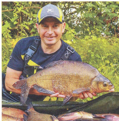
30 Vzhůru na cejny! / nový módní trend!?