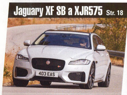
Jaguary XF SB a XJR575 Str. 18