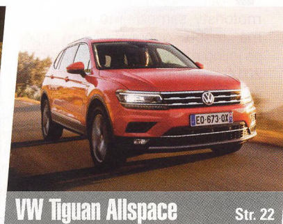
VW Tiguan Allspace