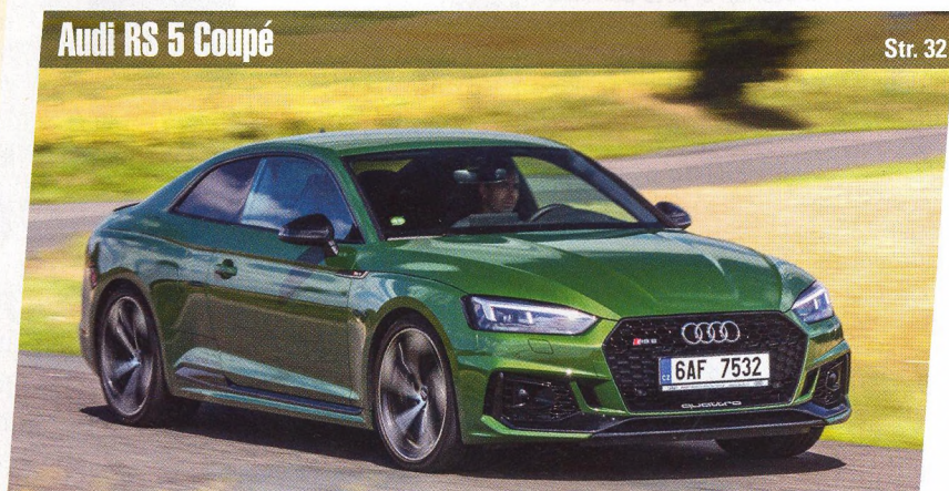
Audi RS 5 Coupé