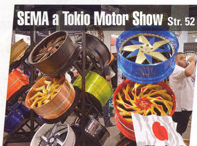
SEMA a Tokio Motor Show Str. 52