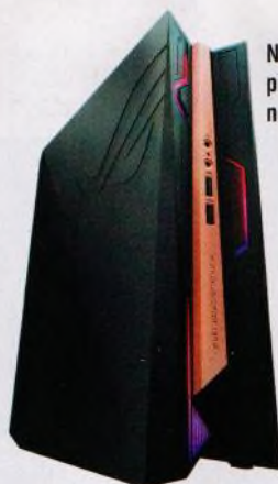
Na stranách 18–21 představujeme nejmenší počítače