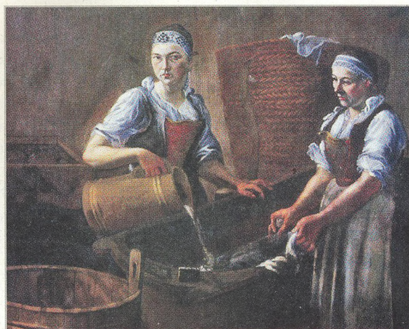
Pradleny z cyklu portrétů ze zámku Manětín. I tyto ženy patřily k obvyklému služebnictvu nobility (str. 34)