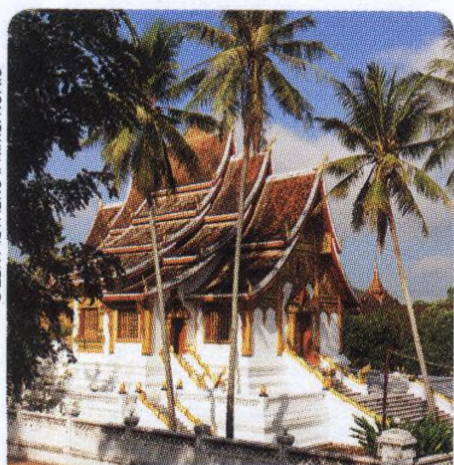
WAT HO PHA BANG (STR. 36), LUANG PRABANG