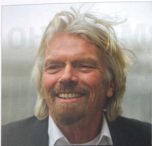
30 SIR RICHARD BRANSON: MILIARDOVÝ KOLOS, SOUKROMÉ OSTROVY A HROMADA ZÁBAVY