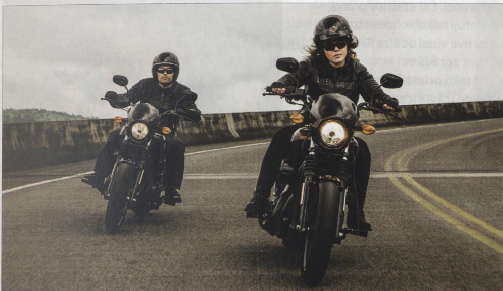
36 HARLEY-DAVIDSON: VÍC NEŽ JEN MOTORKA