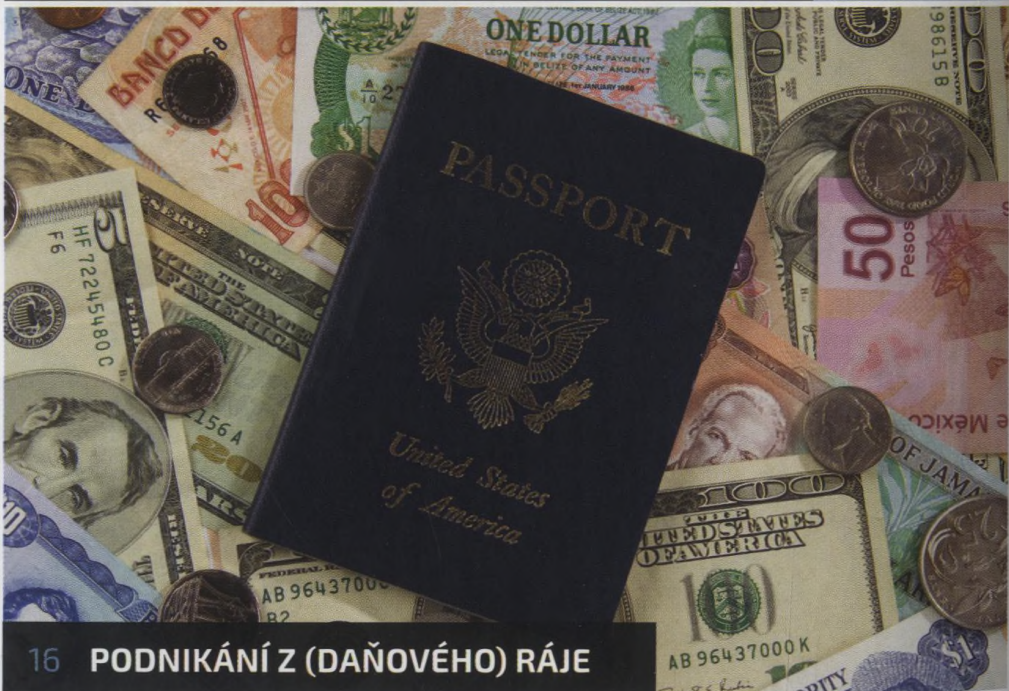
16 PODNIKÁNÍ Z (DAŇOVÉHO) RÁJE