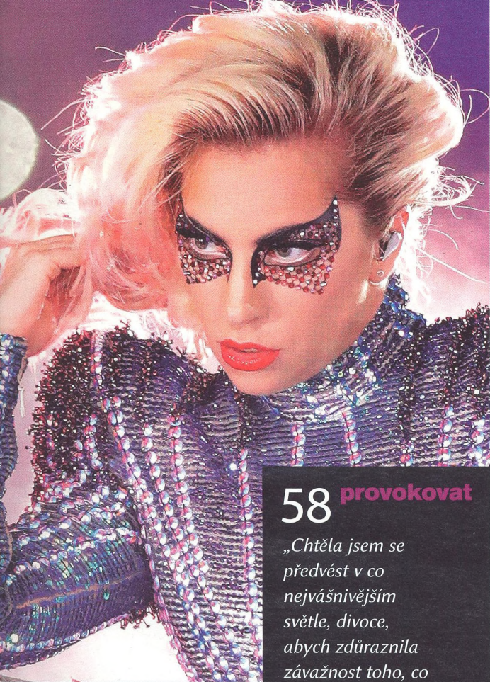
LADY GAGA hudebnice