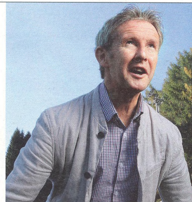
JENS WEISSFLOG skokan na lyžích

„Po návratu domů jsme si od trenérů a funkcionářů vyslechli, jestli bylo nutné se bavit se západoněmeckými skokany.“