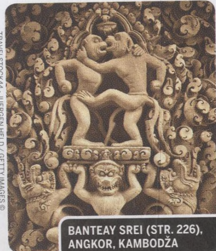
BANTEAY SREI (STR. 226), ANGKOR, KAMBODŽA